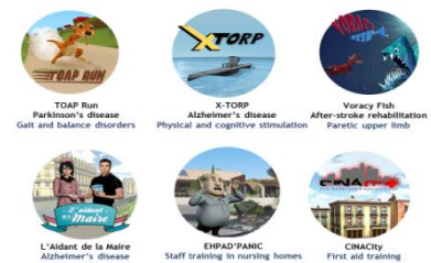
exemples de jeux proposés par le Groupe GENIOUS Healthcare

Par exemple, le jeu TOAP Run est dédié à l'innovation des traitements sur les troubles de la marche et de l'équilibre chez les patients atteints notamment de la maladie de Parkinson. Le but du jeu est d'inciter le patient à bouger en rythme dans les différents décors du jeu en évitant les obstacles et en récoltant un maximum de pièces. Immergé dans un univers 3D coloré, il travaille les postures de déséquilibre telles que les déplacements latéraux, les fentes, la torsion du buste ou encore les extensions.