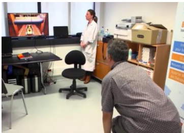
Un patient jouant devant le capteur de mouvement kinect®

Créé en 1983, le groupe GENIOUS est un acteur français innovant spécialisé dans les systèmes d'informations, jeux vidéo thérapeutiques et R&D Santé.