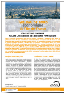
Tableau de bord économique de l'Île-de-France

2 e trimestre 2022 : L'incertitude s'installe malgré la résilience de l'économie francilienne (parution novembre 2022)