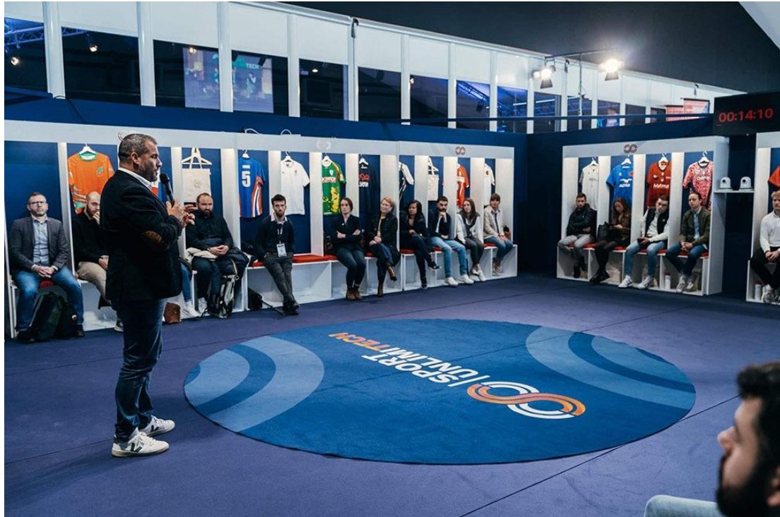
- Le vestiaire Sport Unlimitech -